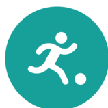
Spel en beweging/ bewegingsonderwijs